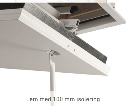
Lem med 100 mm isolering